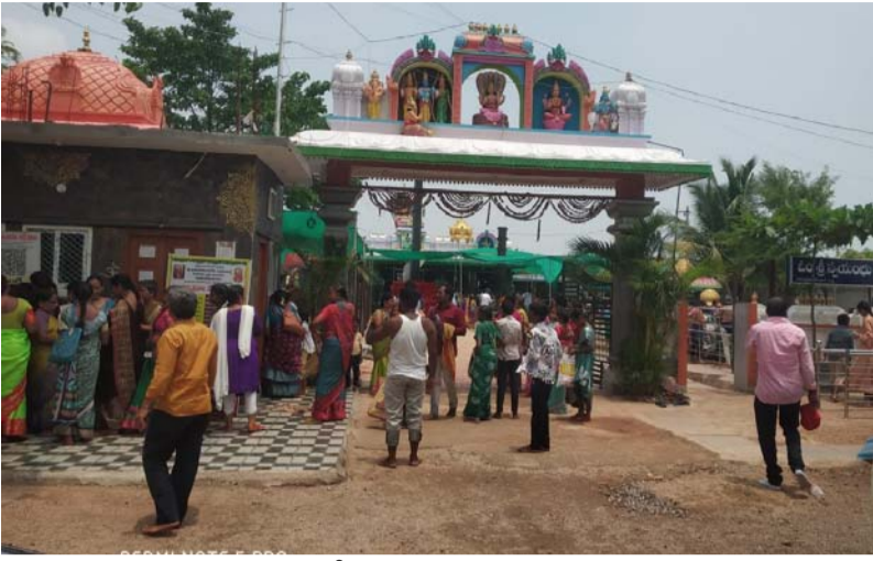
గన్నేరువరం, జూన్ 11

కోరికలు నెరవేరాలంటూ ముడుపులు కట్టిన భక్తులు